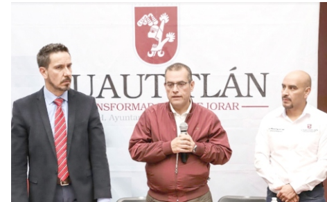
Encaminado a periodistas y servidores públicos se impartió el curso "El Derecho y la Libertad de Expresión en México", por personal de la CNDH, en el palacio municipal de Cuautitlán.

Reconociendo en los comunicadores su importante trabajo para el desarrollo de la sociedad, la administración municipal implementa acciones para combatir las agresiones