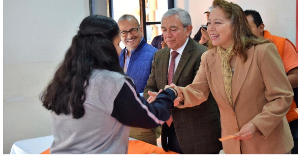
La presidenta del DIF agradeció el apoyo recibido por el edil, a través del cual treinta pequeños recibirán su correspondiente beca.