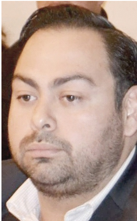
Bravo Suberville destacó que el Presidente Municipal de Tlalnepantla aplica los programas sociales bajo reglas claras y con transparencia.