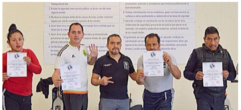
Capacitar a los policías con conocimientos y habilidades que mejoran su capacidad de reacción ante una emergencia