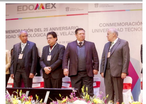
Con motivo de los festejos por el 25 aniversario de la fundación de la Universidad Tecnológica Fidel Velázquez, Navarrete López, precisó que la actual administración ha sido sensible para atender muchas de las necesidades de los universitarios.