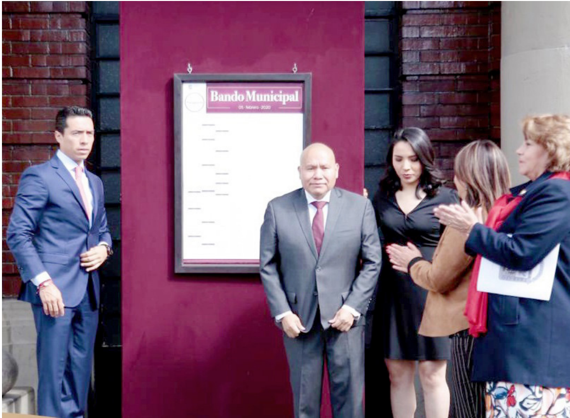
El Bando Municipal establece como obligación de las y los servidores públicos de Nuestra Ciudad, conocer, cumplir y respetar los Códigos de Ética y de Conducta, para dar trato digno, respetuoso, eficiente y eficaz a la ciudadanía tlalnepantlense.

El documento establece que en eventos que impliquen la presencia de medios de comu-