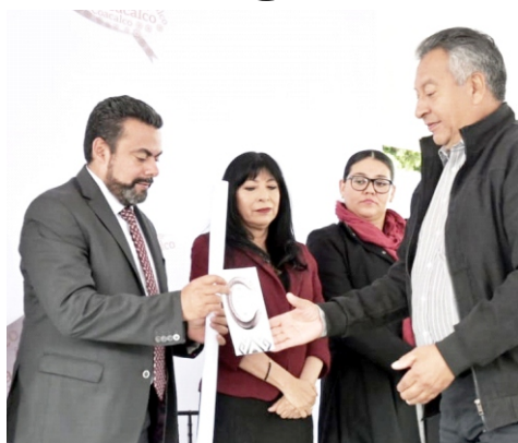
Entre las innovaciones del Bando Municipal 2020 de Coacalco destacan la regulación a estacionamientos.