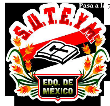
El SUTEyM tiene el compromiso de romper con el caduco sistema de corporativismo sindical ligado al Partido Revolucionario Institucional (PRI).